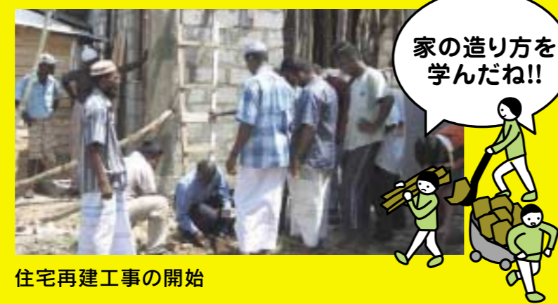
住宅再建工事の開始

地元の資材を活用し、住民自ら作業を行います。建設技能だけでなく、維持・管理する方法も学びます。