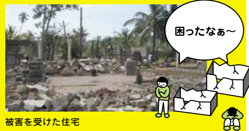
被害を受けた住宅